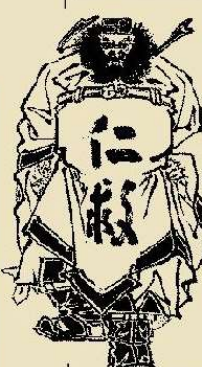
徳島県 明治時代の版木より

理念 漢方薬医薬品の販売は、一人一人の人間をじかに救う事ができるものである。○人身は日本一、天下一の神の御業である。○人を育てるとは、天に通じる心をみがく事にある。