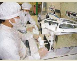
1粒1粒、入念に検査を行う