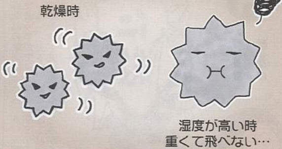
乾燥するとウイルスの飛距離が伸びる

寒い冬には体温が下がりますが、人は体温が1℃下がるごとに免疫力が30%下がると言われています。冬は寒くて水分補給することが減り、さらに乾燥で体表面の水分量も減り、本来ウイルスの侵入を防ぐ働きのある喉や気管支の粘膜がカラカラになると、そこからウイルスが体内に侵入しやすくなります。冬は、かぜのウイルスにとって好条件が揃っています。