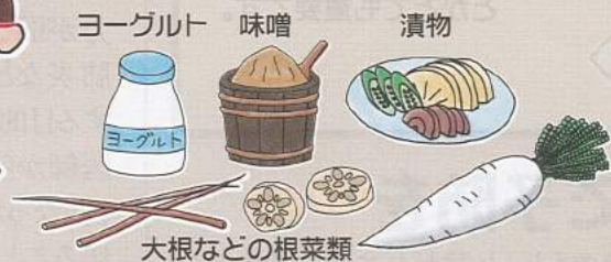
ヨーグルト 味噌 漬物 大根などの根菜類

腸には体全体の免疫細胞の約7割が存在していると言われています。腸が元気に働くと免疫力アップにつながります。腸を元気にするためにヨーグルト、味噌漬物などの発酵食品や善玉菌のエサとなるオリゴ糖や食物繊維を多く含むものを継続して積極的に摂りましょう。善玉菌を増やして腸内環境を整え、免疫力を高めましょう。