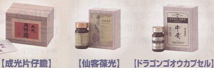
【成光片仔膽】 【仙客葆光】 【ドラゴンゴオウカプセル】

また、強心作用や血圧降下作用、精神安定作用の他、手足のしびれといった麻痺の後遺症や原因不明の高熱に効果を示すなど、効果は多岐に渡ります。免疫細胞を傷つける活性酸素を除去する効果に優れているため、ガン治療のサポートなどにも幅広く使われています。