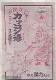
【カッコ湯エキス顆粒H】