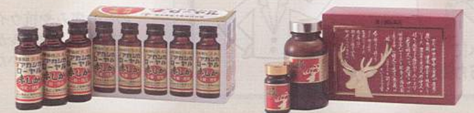
【アカシカローヤル】 【緑文】

鹿茸は虚弱体質冷感性・性功能低下・不妊などに効果を発揮する滋養強壮薬として有名です。さらに、細胞を傷つけガンの原因にもなる活性酸素を除去したり、細菌などの異物を食べるマクロファージの働きを活性化して免疫力を高めます。傷口の再生を早める効果もあるんです。日頃から鹿茸の力で免疫力を高めておきましょう。