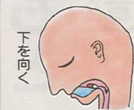
カプセルは水に浮くため下を向いた方が飲みやすいですね